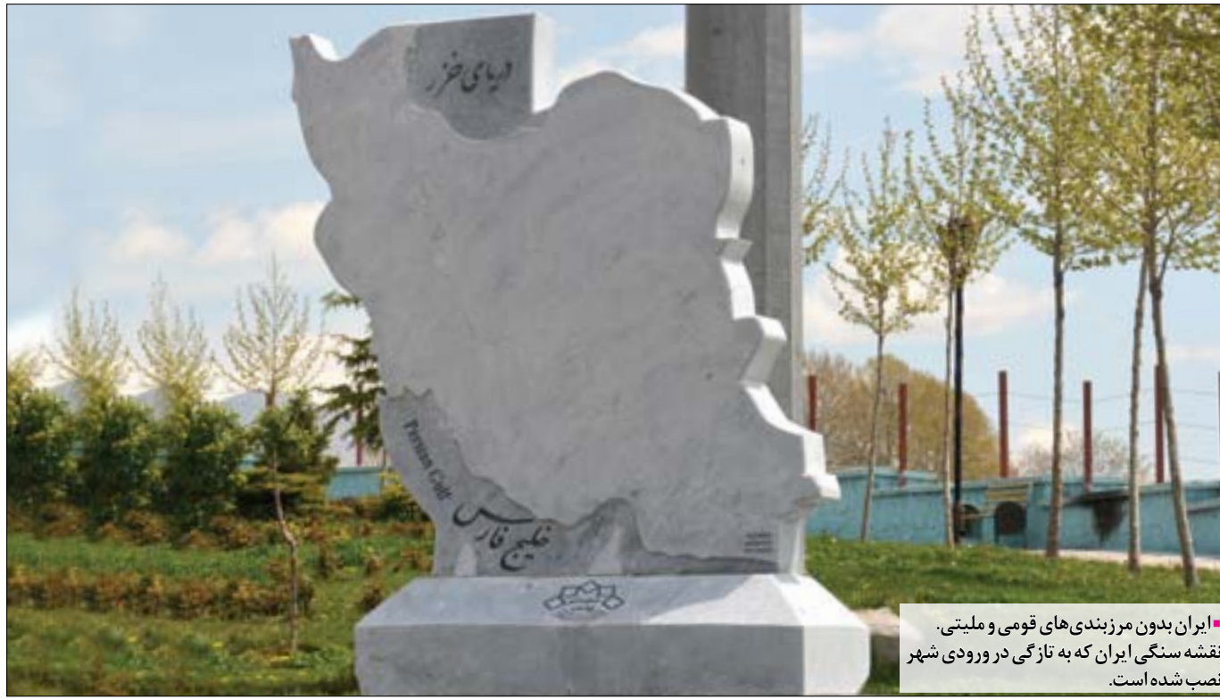
ایران بدون مرزبندی‌های قومی و ملیتی. نقشه سنگی ایران که به تازگی در ورودی شهر نصب شده است.